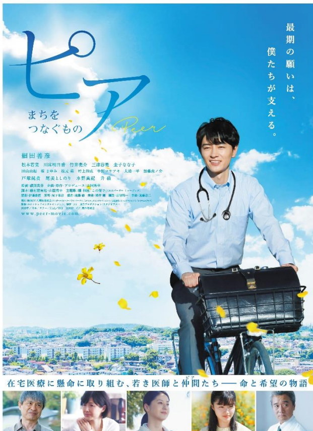
映画「ピア～まちをつなぐもの～」ポスター

追加募集申込期限：令和2年2月17日（月） 令和2年2月12日（水）※郵送消印有効